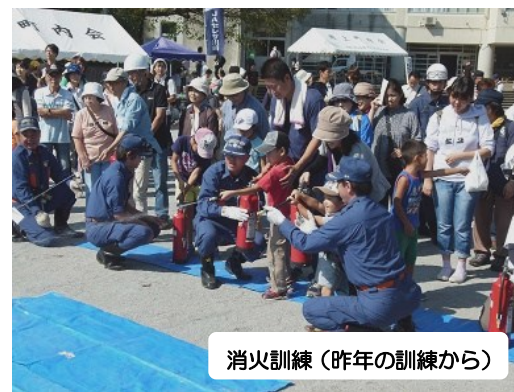
消火訓練(昨年の訓練から)