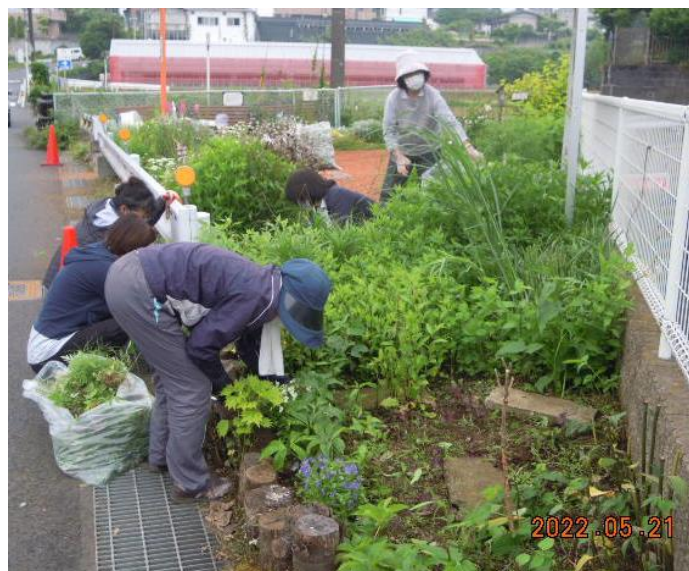
さんかくガーデンでの作業