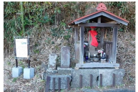
川井田辻の地藏菩薩

岡上地域では、これまでに川崎市地域文化財として20件が決定されています。これらの文化財のうち主に石造物などを、